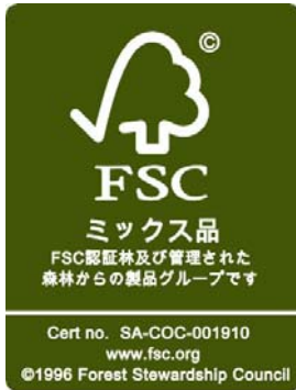
旧 FSC ロゴマーク