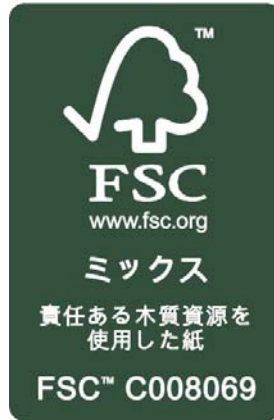
新 FSC ロゴマーク